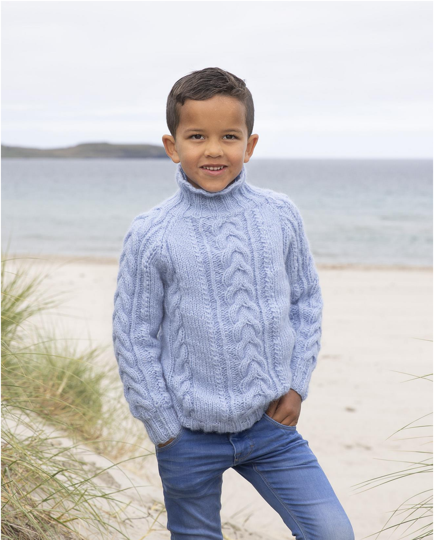
Design: Turid Stapnes