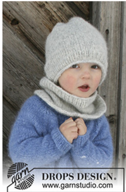
DROPS Children 30-4

"Alternative garn (Garngruppe C)" – se linken under.