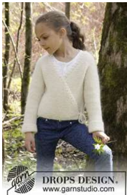
DROPS Children 27-13